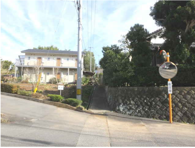
細い道を山へ向かう。