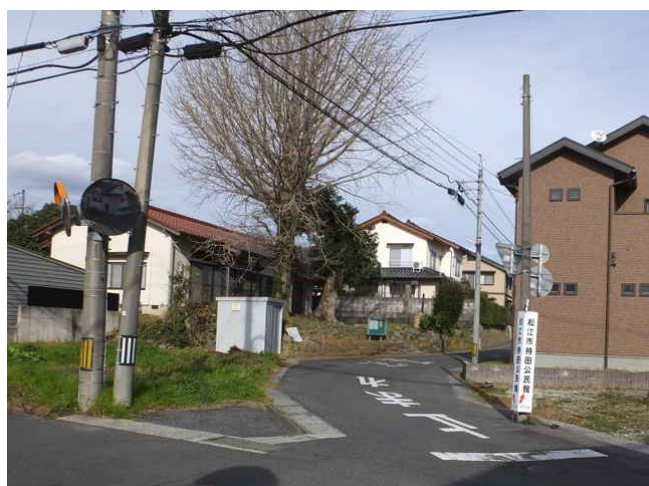
⑱ 持田公民館前へ向かう。