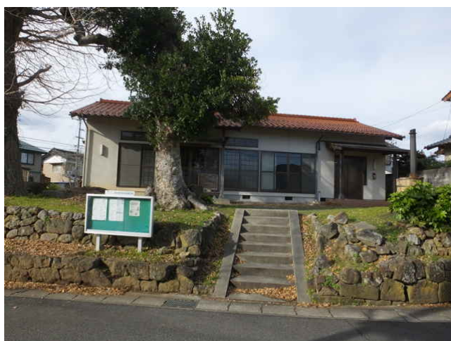
⑲ 公民館手前の井ノ森観音堂