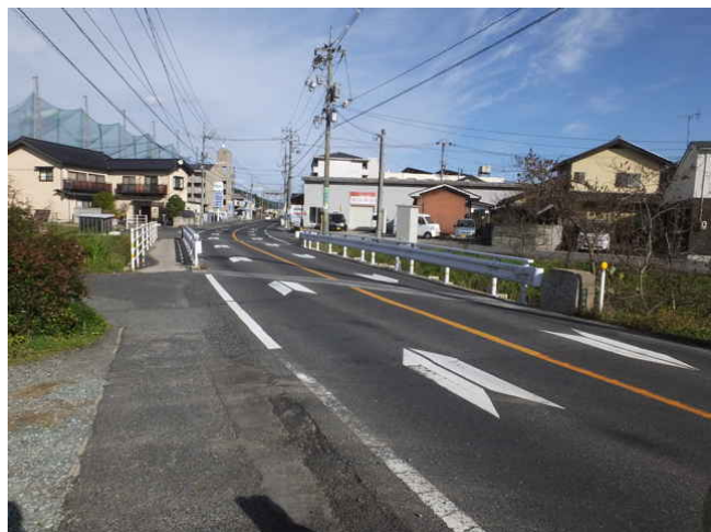
⑯ 旧国道の笠無橋を渡り、左折。

旧国道の笠無橋⑯を渡って、川沿いに左折し、100mほどで右折し荒地を進むと、ゴルフ場⑰のネットの横に出てきます。ネットの横に水路があり、この土手を直進するようですが、草が生い茂り藪状態で通れそうにもないので、道路を回って反対側へ行きました。そこから道が伸びて旧国道へ接し、すぐ左折すると持田公民館の入り口⑱へ出てきます。公民館の手前には井ノ森観音堂⑲があり、その北北西1kmには鬼門除けの持田神社⑳があります。