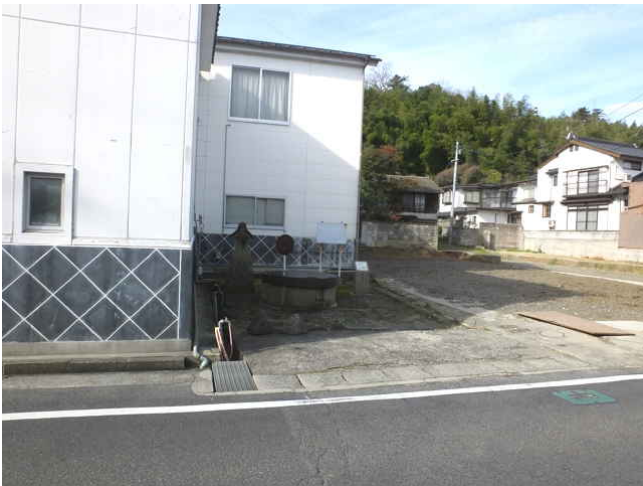
李白酒造横の赤崎の大井戸