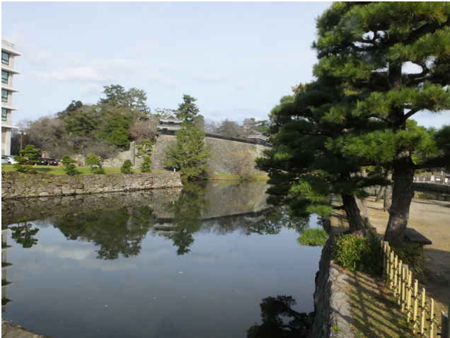
① 三の丸（県庁前）から出発

報告書には松江城三の丸（県庁）前①を出発し、北堀橋②を渡ってから直進するルートと、左折し150m程先で右折するルートが記されていますが、今回は直進しました。石橋町に入ると、千手院③や順光寺④、光徳寺⑤、児守稲荷神社⑥など松江藩ゆかりの社寺が多くあります。菅田町へ越える坂道は切り通しで、その入口には赤崎観音堂⑦がありました。今は古い石地蔵や手水鉢が残っているのみです。