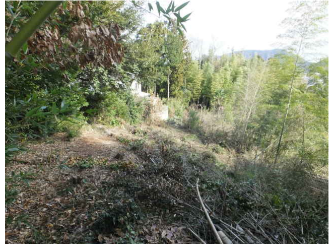
⑨ 尾根から斜面を下る。