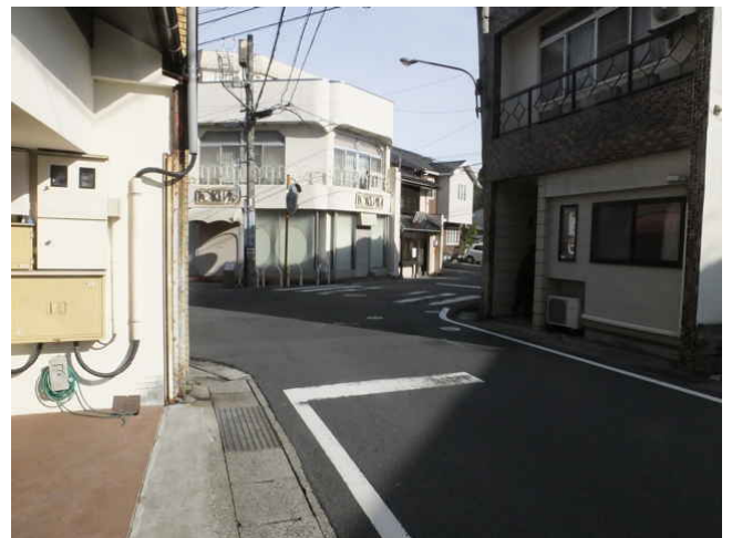
石橋跡を右折し、石橋町へ。