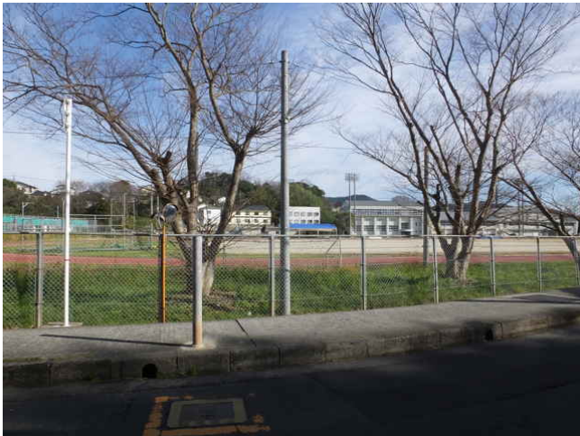
⑩ グラウンドはフェンスがある。