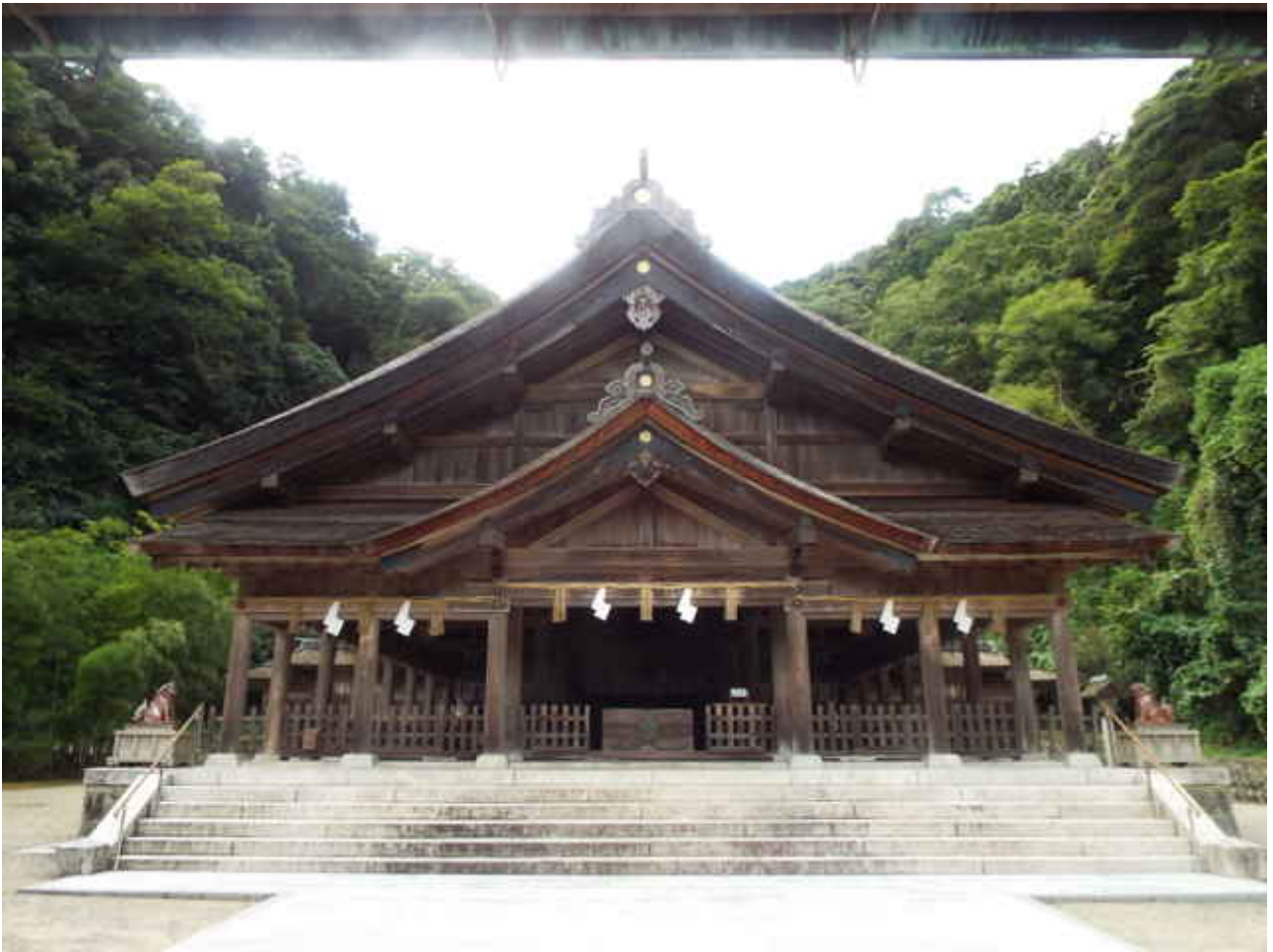
美保神社（美保関町）