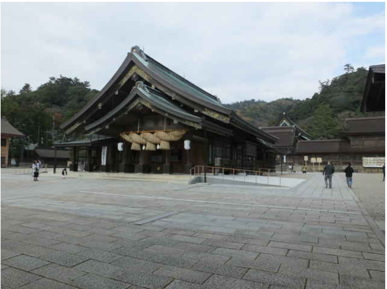
出雲大社（出雲市大社町）