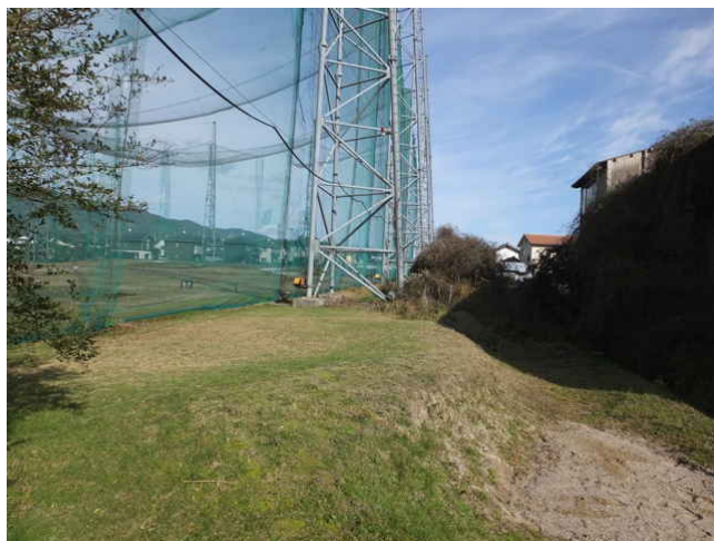
⑰ ゴルフ場の横が通れない。