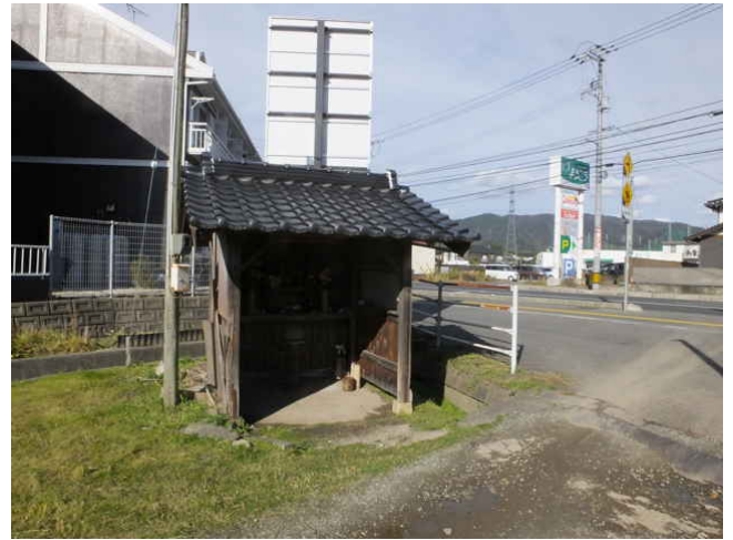
⑮ 松江島根線に出る。