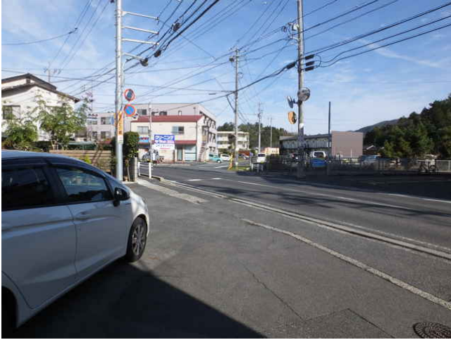
⑫ 一旦、旧国道へ出る。

報告書の地図では、Aコープかわつの北東角から右へ折れるようになっていますが、住宅で遮られて道がありませんでした⑭。Aコープから嵩見団地の横を直進すると、松江島根線⑮に出て、向かいのスーパーマーケットの駐車場を横切って、旧国道へ出ます。