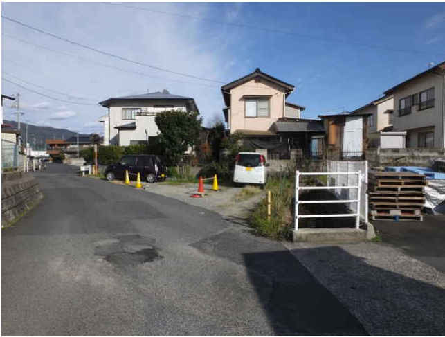
⑭ 右へ行く道がない。