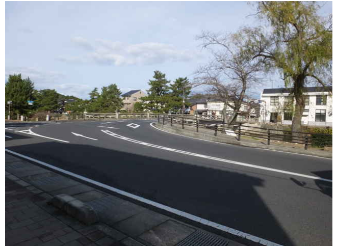
② 右へ北堀橋を渡る。