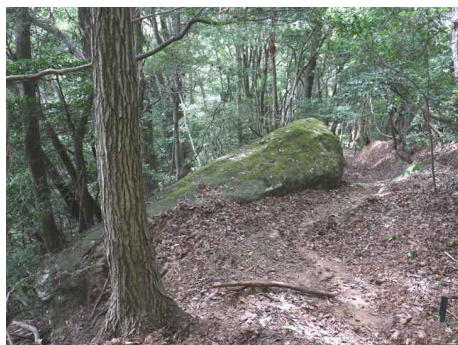
昼寝石の上からの様子