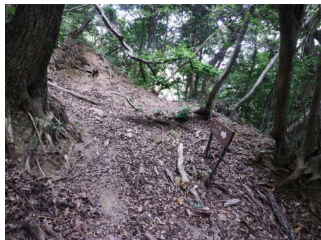
下山道の標識（福原へは通行不能）