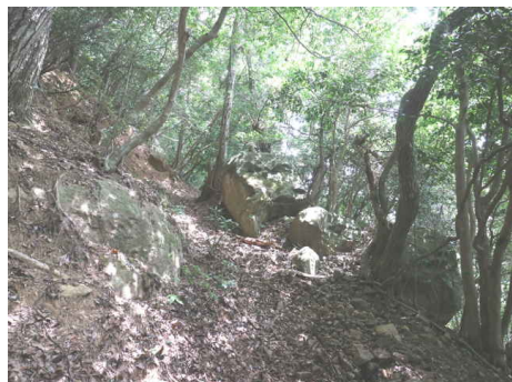
前方に大岩が見える。