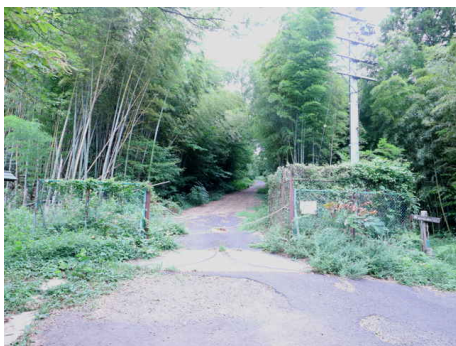
澄水山頂上は立入禁止