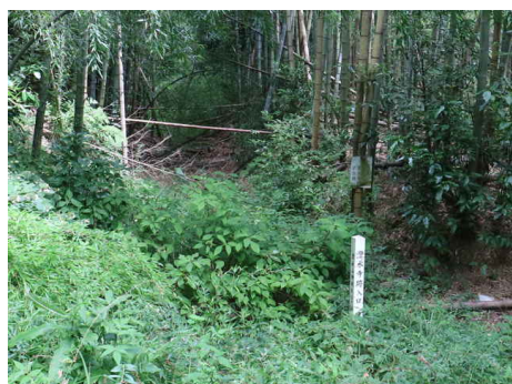
「澄水寺跡入口」の標識