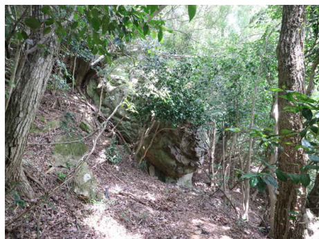
前方に大岩「ばあ石」がある。