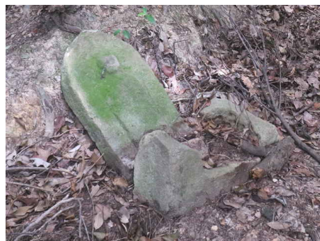
所々に一丁地蔵が残っている。