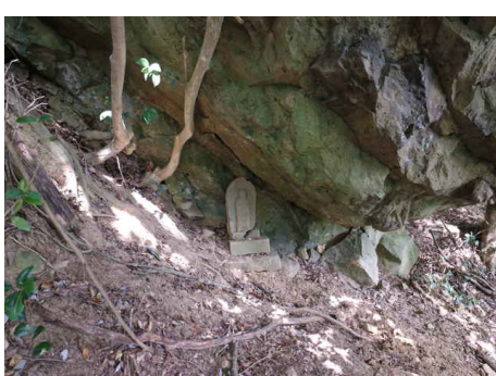
岩の基部に石地蔵がある。