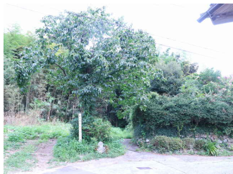
突き当りの登山道入口