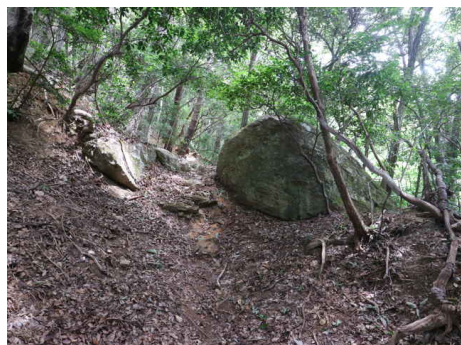
右の大岩は「昼寝石」