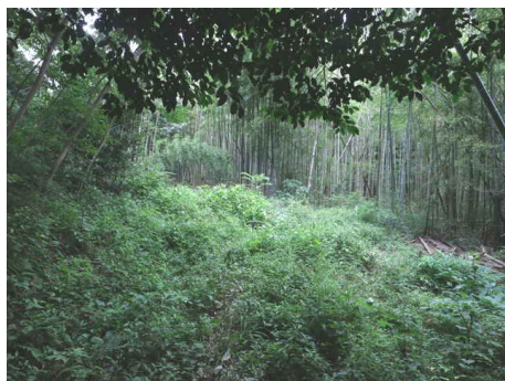
前方が草地になる。