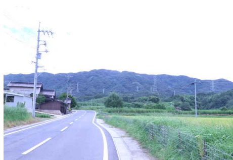
坂本町から見た澄水山（北山）