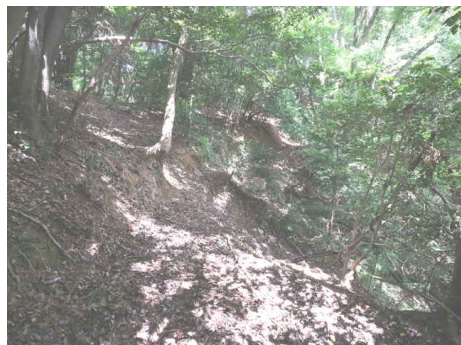
一部斜面が崩れている。