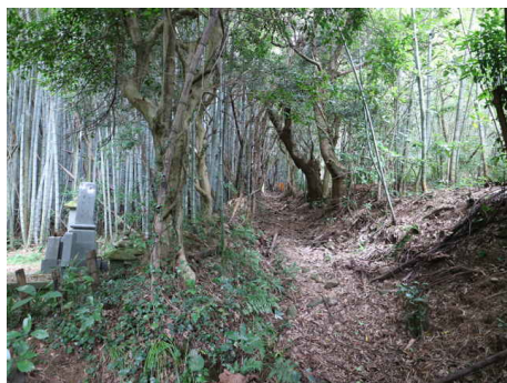
墓地の脇を過ぎる。