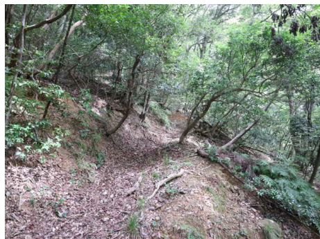
尾根をつづら折れに登る。