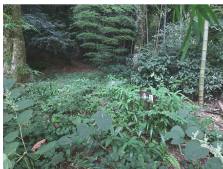
左へ曲がると「山頂」の標識がある。