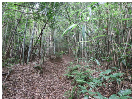
更に急斜面を登る。